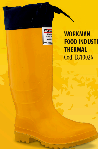
WORKMAN FOOD INDUSTRY THERMAL Cod. E810026